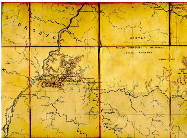
Fig. 2. Detalhe de mapa mostrando o extremo oeste da província no último quartel do século XIX