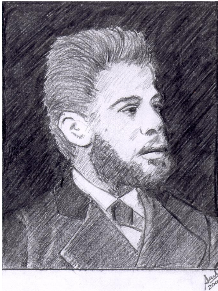
Jorge Tibiriçá Piratininga (cientista ituano do século XIX) Crayon do autor, inspirado em fotografia, como indicado na nota 4