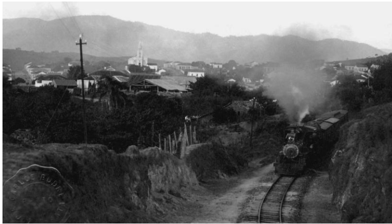
Trecho da linha férrea, vendo-se ao fundo o bairro do Rosário