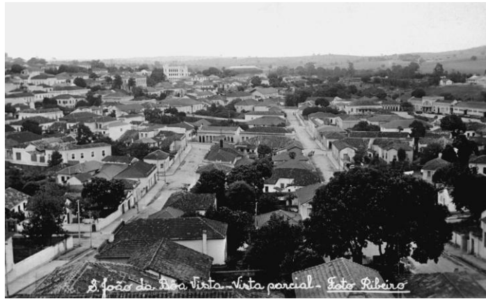
Vista parcial de São João da Boa Vista