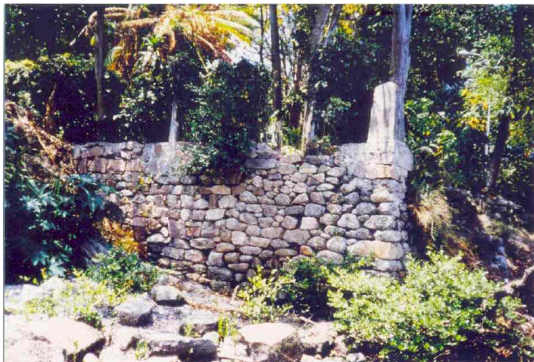
Fig. 3 – Parte da murada, setor menos agredido, vista da pequena praia, mostrando peças caídas junto ao mar. (P.Naus 02 – SW 1986).

Após cerca de trinta anos do tombamento deste ancoradouro histórico não se concretizaram quaisquer providências para a restauração ou mesmo para a sua conservação.