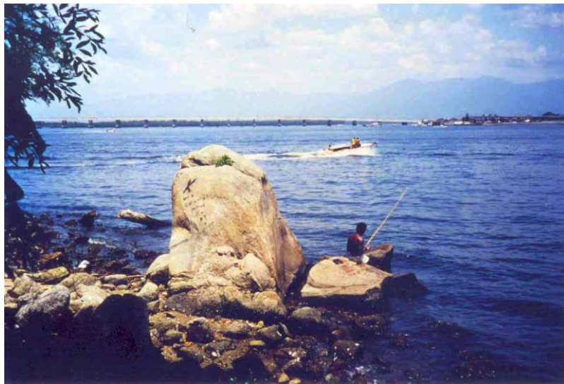
Fig. 8 – Paisagem fronteira do ancoradouro, vendo-se o Mar Pequeno do Porto do Rei., tendo-se, à direita, o Tumiaru. (P.Naus 14 – SW1986)