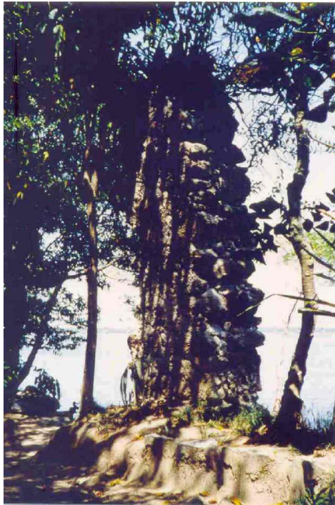
Fig. 6 - Vista de uma das colunas que se apresenta ainda com altura talvez próxima a da original (P.Naus 11 – SW1986)