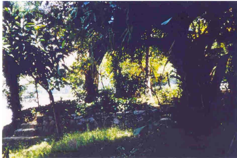
Fig. 7 – Aspecto da plataforma interna forrada também por vegetação de ajardinamento. (P.Naus 13 – SW1986)