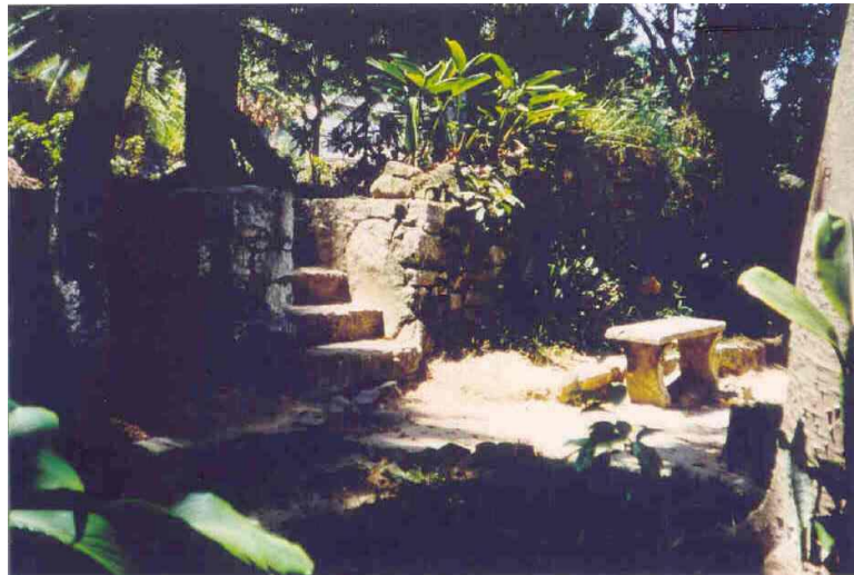
Fig. 5 – Escada faz o acesso à plataforma em meio à vegetação de pressão.

O TESOURO DOS MAPAS: A CARTOGRAFIA NA FORMAÇÃO DO BRASIL. São Paulo: 2002, 339 p. Instituto Cultural Banco Santos.