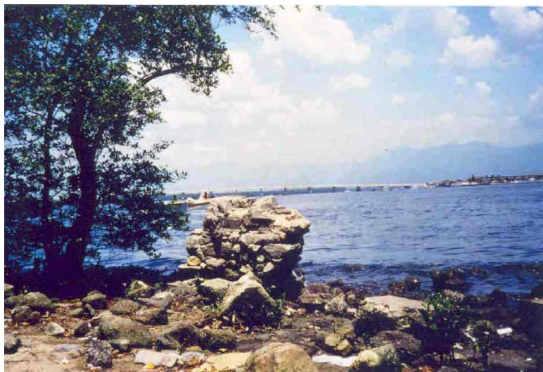
Fig. 1 – Vista dos restos de uma coluna de pedra sobre a plataforma diante do Mar Pequeno.