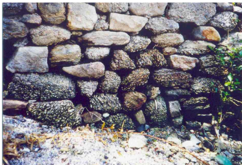
Fig. 4 – Detalhe da murada, diante do mar, que mostra a alvenaria em perfeito estado. (P.Naus 04 – SW1986)