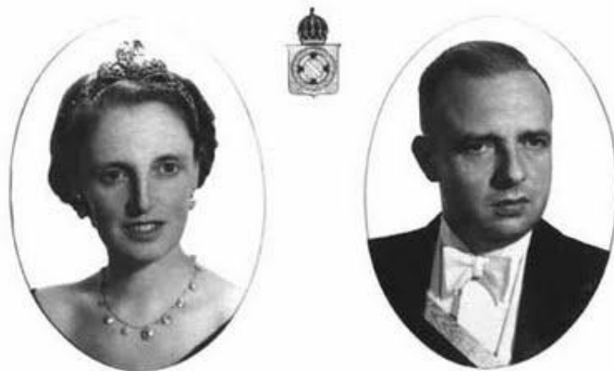
Figura 4 SS AA II e RR o Príncipe D. Pedro Henrique de Orleans e Bragança, Chefe da Casa Imperial do Brasil, e sua consorte, Princesa D. Maria Elizabeth da Baviera.