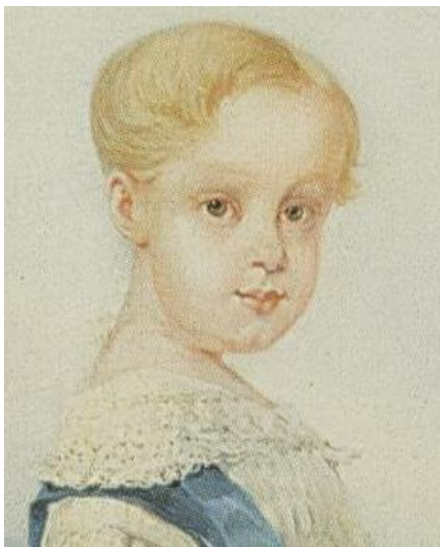
Figura 1 Dom Afonso Pedro. Crédito: Óleo de J. M. Rugendas. Coleção Dom Pedro Gastão de Orléans e Bragança, Palácio do Grã-Pará, Petrópolis.

Todos os esforços foram realizados para se obter a autoria e a origem das fotografias utilizadas neste artigo. Algumas fotos foram publicadas em sites pela internet. Como não foi possível associar o crédito a algumas delas, nos colocamos à disposição para publicar os respectivos créditos em uma próxima edição, se os fotógrafos ou titulares se manifestarem.