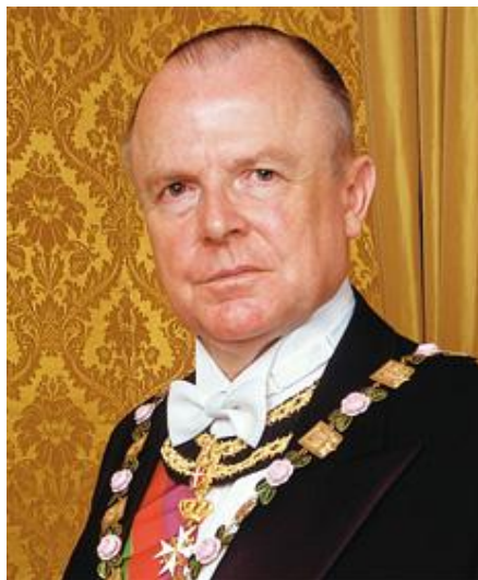
Figura 3 S A I e R Dom Luiz Gastão de Orléans e Bragança, Chefe da Casa Imperial do Brasil