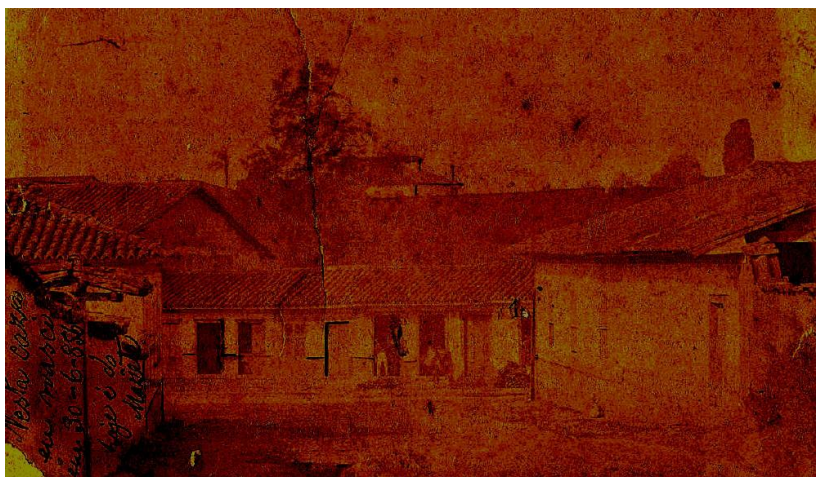
Fig. 2 – Vista da Travessa Paissandu ( Rua Cap. Salomão) tendo, ao fundo, a construção mais alta, o Seminário das Educandas e um dos vários coqueiros ali existentes junto à Ponte da Abdicação, por volta de 1870.

O Largo vinha mudando de função e, ali, na metade do século 19, um restaurante e uma quadra para jogos de bolão (Kegelbahn) tinham sido montados já por Carlos Frederico Schaefer, reunindo alemães da cidade. Escolas como o Colégio Ipiranga e outros se estabeleceram também no Acu destes tempos.