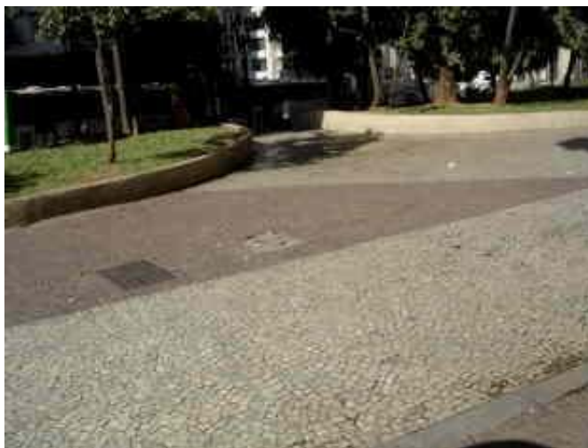
Fig. 3 – Largo do Paissandu. Local das nascentes cujas águas desciam agora pela Travessa Paissandu em direção ao Anhangabaú, pelo centro e acima na figura.

Esta fama do Largo no século 20, à noite, vinha já dos séculos anteriores.