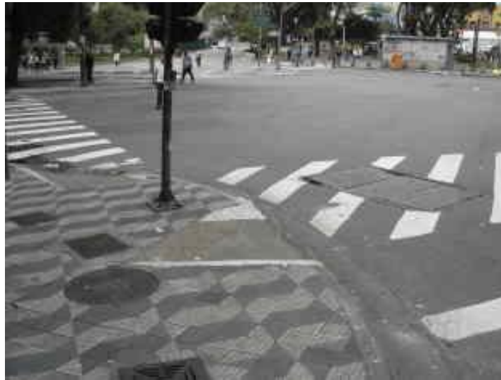
Fig. 4 – Local onde se acha canalizada a Bica do Acu. Esquina da R. Brigadeiro Tobias com a R. do Seminário. Foto S.Weber / 2011.